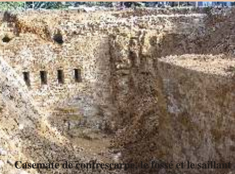
Casemate de contrescarpe, le fosse et le saillant