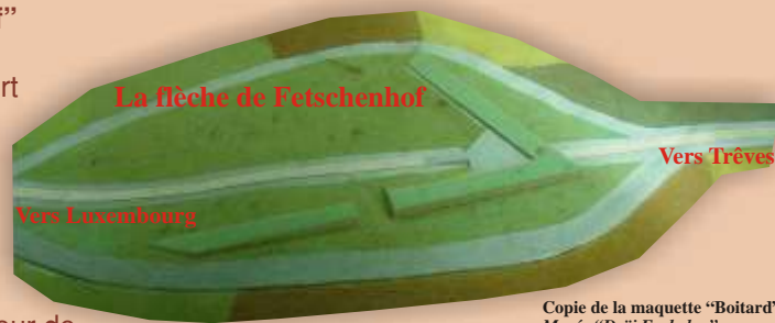
Copie de la maquette "Boitard" Musée "Dräi Eechelen"

Cents et d'empêcher sur ce site l'installation d'une batterie française menaçant le centre de la ville et forteresse de Luxembourg. En même temps, l'ouvrage coupait la route de Trèves.