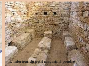
L'intérieur du petit magasin à poudre