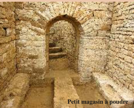
Petit magasin à poudre