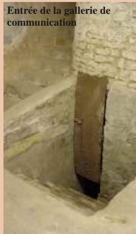
Entrée de la galerie de communication