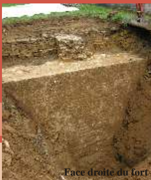
Face droite du fort