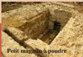
Petit magasin à poudre