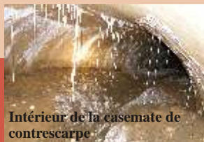
Intérieur de la casemate de contrescarpe