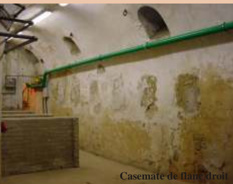
Casemate de flanq. droit