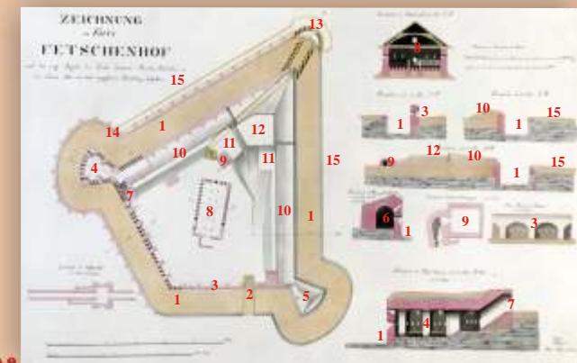
Le projet prussien de 1836/37, tel qu'il fût réalisé en grandes parties