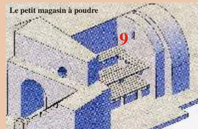
Le petit magasin à poudre