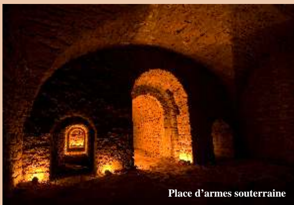
Place d'armes souterraine